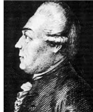
Gottfried von Swieten.

Nicht allein chronologisch liegen Die Schöpfung und Die Jahreszeiten eng beieinander (ihre Uraufführungen datieren von 1799 bzw. 1801), auch inhaltlich weisen sie manche Verbindungsstränge auf. Stand bei ersterem Werk der biblische Bericht von der Erschaffung der Welt, der Pflanzen, Tiere und des Menschen im Mittelpunkt, so bildet in der späteren Komposition die göttliche Schöpfung die Basis für das gesamte Geschehen: Indem der