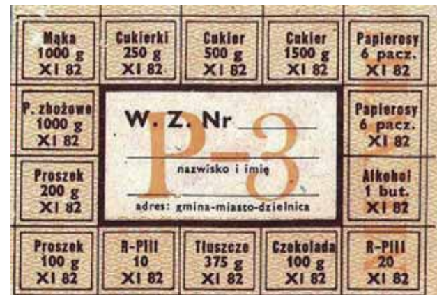
Lebensmittelrationierung im Rahmen des Kriegsrechts in Polen 1981–83.

Ein kraftvolles, berührendes Zeugnis seines tiefverwurzelten katholischen Glaubens begegnet uns in diesem Werk, getragen von der Sorge um seine krisengeschüttelte Heimat, in der ab 1980 das Kriegsrecht regierte. Die Hoffnung auf ein »neues Leben«, von dem