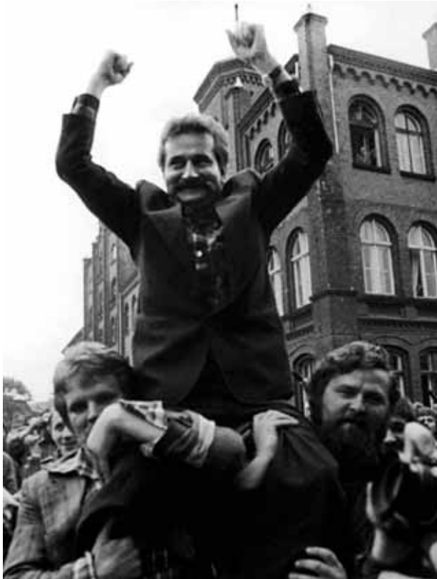
Lech Wałęsa am 30.8.1980 nach der Unterzeichnung des ersten Punktes einer Vereinbarung mit der Regierung.

Das heutige Konzert im November 2010 ist in besonderer Weise geeignet, sich die zurückliegenden Ereignisse wieder ins Gedächtnis zu rufen: Die Vereinigung der beiden deutschen Staaten vor zwanzig Jahren kann als eine unmittelbare Folge der Entwicklungen in Polen begriffen werden. Dreißig Jahre ist es her, dass die Solidarność die Autorität von Partei und Staat herausforderte, ebenso sind drei Jahr-