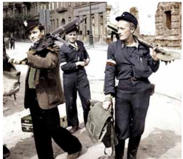
Soldaten der polnischen Heimatarmee: 1944 war Warschau während zweier Monate freies Polen mit einer legalen Regierung, Verwaltung, und Armee.

1982 komponierte Penderecki das »Recordare Jesu Pie« anlässlich der Seligsprechung von Pater Maximilian Kolbe, der sich 1941 im Konzentrationslager Auschwitz für seine Mitgefangenen geopfert hatte. 1984 schließlich wurde mit dem »Dies irae« (das nicht mit dem deutlich früher entstandenen, eigenständigen Werk von 1967 zu verwechseln ist) ein gewichtiger Teil des Polnischen Requiems in Partiturform gebracht. Anlass hierfür war die Erinnerung an den 40. Jahrestag des Warschauer Aufstands. Auch das »Liberate me Domine« verdankt sich einer musikalischen Trauerarbeit: Es wurde, ebenfalls 1984, zum Gedenken an das Massaker von Katyn, bei dem