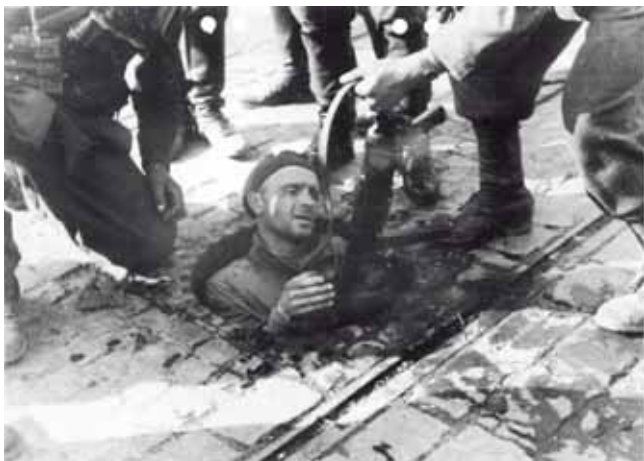
Warschauer Aufstand: Ein polnischer Soldat wird aus den Kanälen unter Warschau heraus von deutschen Truppen gefangengenommen. Nachdem Hitler die Nachricht über den Warschauer Aufstand erhielt, gab er den Befehl, alle Stadtbewohner zu töten und die Stadt dem Erdboden gleich zu machen. Stalin stoppte seine Offensive, um die Deutschen im Kampf gegen die Aufständischen nicht zu behelligen. 40 000 Zivilpersonen kamen dabei innerhalb weniger Tage ums Leben.

Bewahre die Seelen aller verstorbenen Gläubigen vor den Qualen der Hölle und lass sie vom Tode hinübergehen zum Leben.