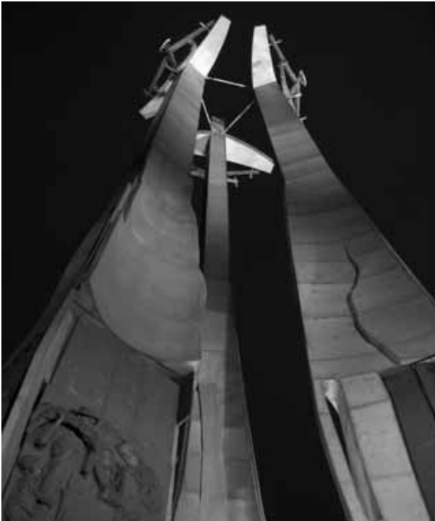
Monument für die 1970 gefallenen Werftarbeiter in Danzig.

Das Polnische Requiem , das bis auf wenige Ausnahmen dem lateinischen Text der Totenmesse folgt, entstand in mehreren Etappen: Die Keimzelle, aus der die Gestalt des großdimensionierten Werkes heraus entwickelt wurde, war das »Lacrimosa«, das Penderecki 1980 komponiert hatte. Geschrieben war es zum Gedenken an die 28 Danziger Werftarbeiter, die zehn Jahre zuvor bei gewaltsamen Konflikten