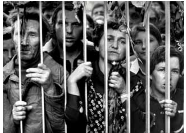
Familienangehörige der Streikenden hinter dem Danziger Werfttor (Foto: B. Nieznański / Karta).

Für Stimmen – und insbesondere für Chor – hat Penderecki oft und gern komponiert. Der enorme Modulationsreichtum, der durch Vokalistinnen möglich war, inspirierte ihn zu einer ganzen Reihe hervorragender Werke, die vor allem durch ihre unmittelbar wirksame expressive Kraft sowie durch ihre emotionale Direktheit bestechen. Den Beginn der Beschäftigung mit sakraler Chormusik – oft mit, zuweilen aber auch ohne Mitwirkung des Orchesters – markierte eine Vertonung des lateinischen Stabat Mater von 1962. In den mittleren 1960er Jahren wandte er sich der Komposition der Lukas-Passion zu, die nach dem Vorbild der Bach'schen Passionen entstand, aber einer – ungemünzt eindrucksvollen – zeitgenössischen Tonsprache verpflichtet ist. Die besonderen kompositorischen Techniken der 1966 uraufgeführten Lukas-Passion , die zur Herstellung bestimmter Klangphänomene führten, waren ihm Richtschnur für seine folgenden chorsinfonischen Werke, darunter ein Dies irae (1967), Kosmogonia (1970), Utrenja I und II (1970 bzw. 1971) ein Magnificat (1973) sowie ein Te Deum , das er 1978, nach der Wahl seines Freundes Karol Wojtyła zum Papst, zu komponieren begann.