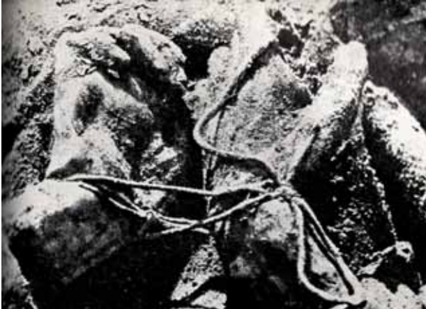
Katyn: Auf dem Rücken gefesselte Hände eines 1943 exhumierten Exekutionsopfers.

1940 die Elite der polnischen Armee durch Einheiten des sowjetischen Innenministeriums NKWD ermordet worden waren, geschrieben.